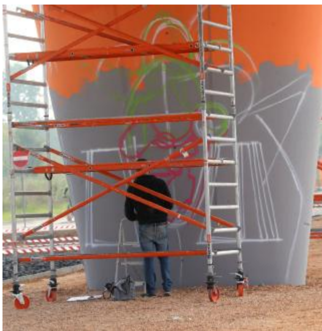
Le creazioni su una base grigia preparata da detenuti di Verziano

«L'AMMINISTRAZIONE sostiene iniziative come questa perché, oltre alla repressione, bisogna puntare su politiche di prevenzione di atti di inciviltà e di degrado, lanciando il messaggio: no alle tag si a