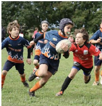
Tra i 12 e i 14 anni fa sport il 75,5% dei ragazzi intervistati

Tra i 9.726 partecipanti al questionario, il 67,3% dichiara di praticare sport, il 17,6% di averlo praticato in passato e il 15,1% di non averlo mai praticato. Il sondaggio, avviato nell'autunno del 2025 per orientare le future politiche sportive cittadine, ha raccolto risposte per il 54% da donne e per il 46% da uomini. Due terzi dei partecipanti