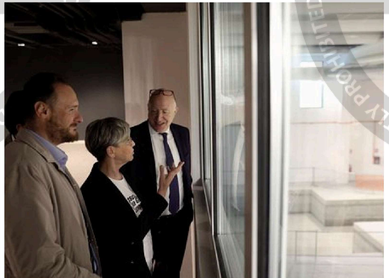
Il centro per la preparazione olimpica della ginnastica artistica di Sanpolino è stato ultimato e sarà fruibile dalla fine di giugno; il Comune e la Federazione italiana hanno firmato l'accordo di cooperazione per l'utilizzo dell'impianto sportivo

Le opere sono state ultimata: tra due mesi e mezzo quarantadue giovani atlete da tutta Italia potranno fruire di un centro di allenamento di preparazione olimpica per la ginnastica artistica. Così, la periferia di Brescia - e nello specifico il quartiere di Sanpolino - si riconfigura accrescendo le sue potenzialità sportive. Nel nuovissimo centro federale, le azzurre non svolgeranno soltanto l'attività di preparazione alle competizioni internazionali, ma a tutti gli effetti trascorreranno gli anni della formazione. Infatti il polo è attrezzato con una trentina di camere e ha anche uno spazio destinato alla ristorazione.